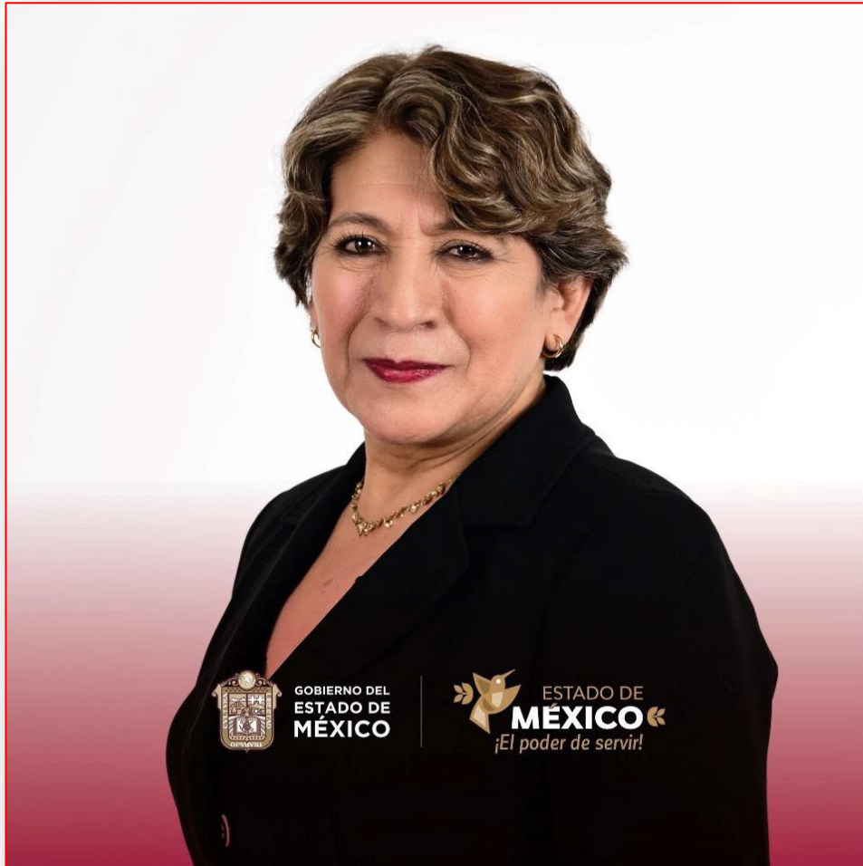
DELFINA GOMEZ ALVAREZ GOBERNADORA DEL ESTADO DE MÉXICO 2023 - 2029